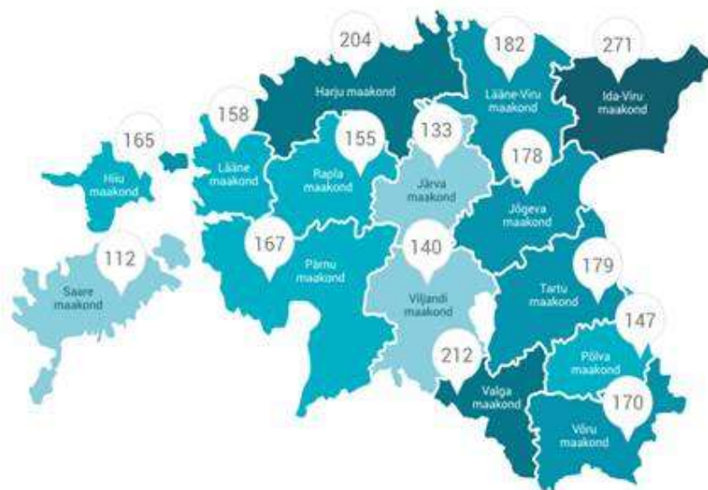
Kuritegude arv 10 000 inimese kohta maakondades